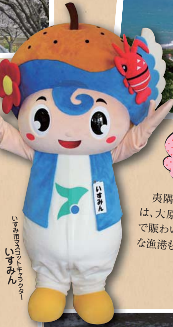
いすみ市マスコットキャラクター